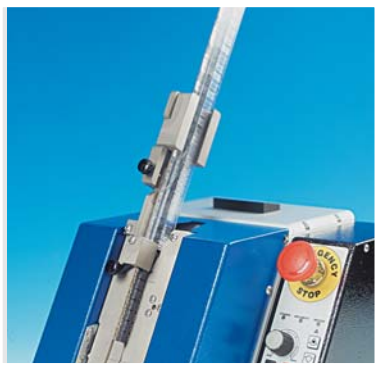
TP/TC4 con supporto stecca BR5 TP/TC4 with stick holder BR5 ( Cod 78.0005)