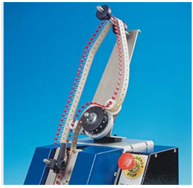
Porta Bobina BR3 Reel Holder BR3 P. 12.7 mm ( Cod. 78.0001) P. 15 mm ( Cod. 78.0002)

cutting machine for loose radial components