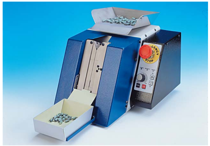
TP/TC4 220 V (Cod. 74.OL22) TP/TC4 110 V (Cod. 74.OL21)

DIAM. REOFORO = 0,4 - 0,8 mm PRODUZIONE = SFUSO 3.000 p/h NASTRATO 15.000 p/h LEAD DIA. = 0,4 - 0,8 mm (.015-.031") PRODUCTION = LOOSE 3.000 p/h TAPED 15.000 p/h